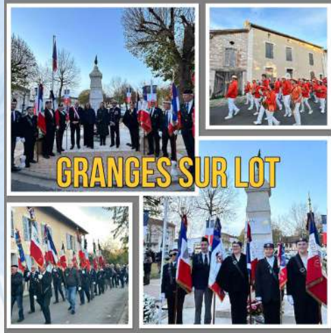
GRANGES SUR LOT