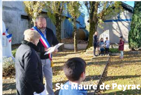
Ste Maure de Peyrac