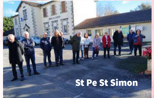
St Pe St Simon