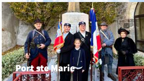
Port ste Marie