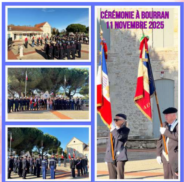
CÉRÉMONIE À BOURRAN 11 NOVEMBRE 2025