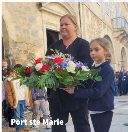
Port ste Marie