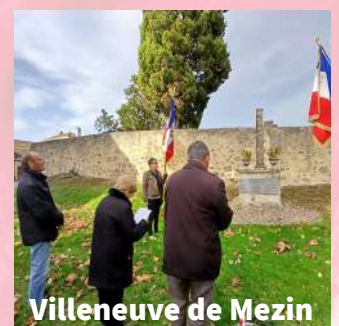
Villeneuve de Mezin