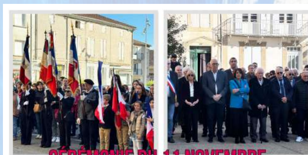
CÉRÉMONIE DU 11 NOVEMBRE 2025 A AIGUILLON