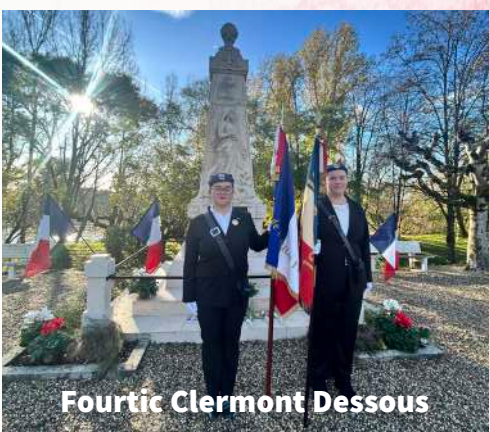
Fourtic Clermont Dessous