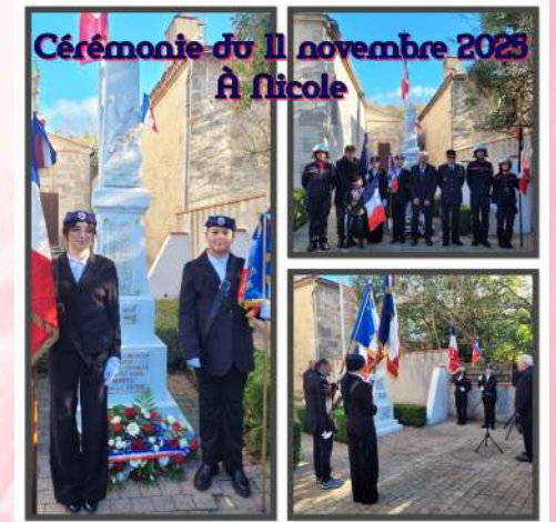
Cérémonie du 11 novembre 2023 À Nicole