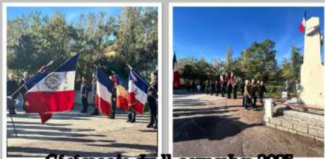
Cérémonie du 11 novembre 2023 À Saint Léger