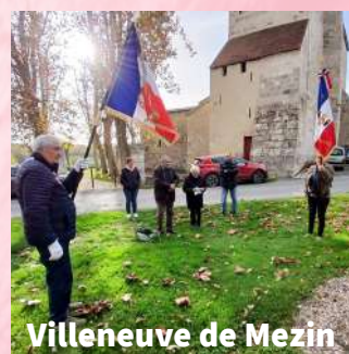
Villeneuve de Mezin