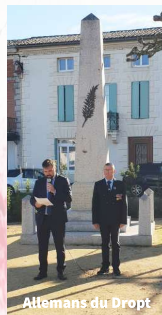
Allemans du Dropt