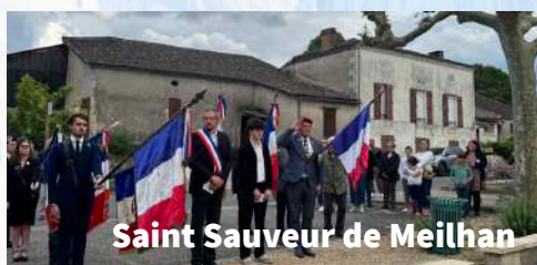
Saint Sauveur de Meilhan