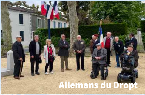
Allemans du Dropt