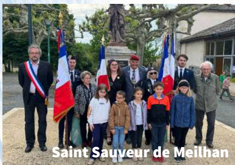
Saint Sauveur de Meilhan