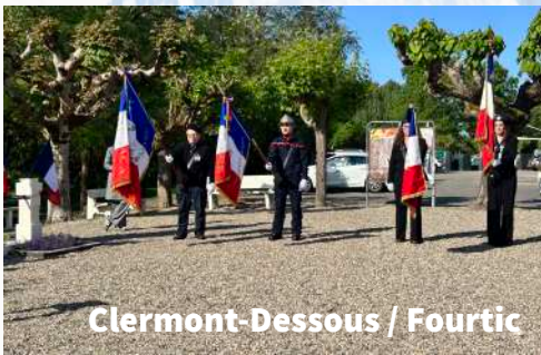
Clermont-Dessous / Fourtic