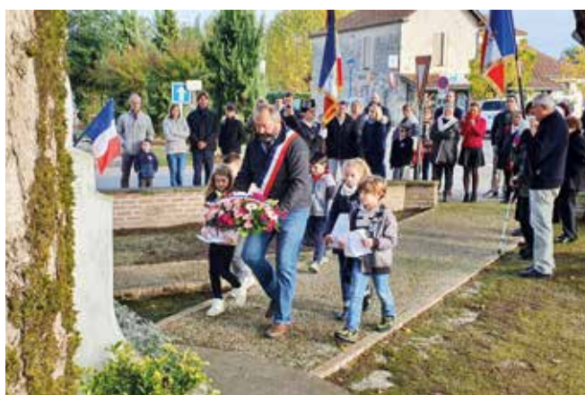
Ste Maure de Peyriac