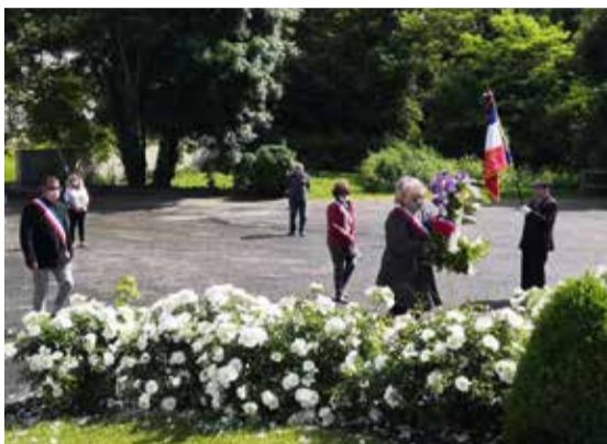
À Meilhan sur Garonne