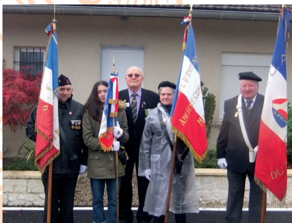
Le 11 Novembre 2018 à Sainte-Marthe