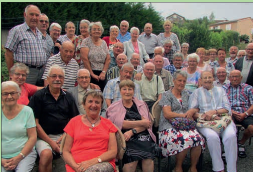
Groupe à la journée détente.